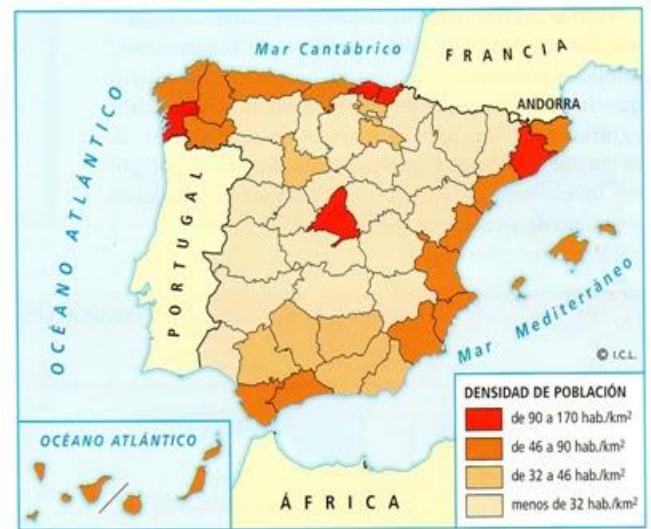
DENSIDAD DE POBLACIÓN EN ESPAÑA A FINALES DEL SIGLO XIX

Las ciudades vivieron enormes cambios tecnológicos y sociales: iluminación de calles con farolas de gas, estaciones de ferrocarril, construcción de redes de alcantarillado. Pero la transformación de mayor alcance fue, primero, el derribo de las antiguas murallas, que impedían su crecimiento, y luego, la construcción de ensanches o barrios de nueva planta, planificada según los criterios del nuevo urbanismo de la época.