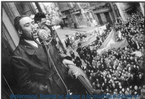
Belarmino Tomás se dirige a la multitud desde el balcón del Ayuntamiento de Sama de Langreo.

Belarmino Tomás Álvarez (29 de abril de 1892, Gijón-14 de septiembre de 1950, México), sindicalista y político asturiano. Fue secretario del Sindicato Minero Asturiano (federación minera de UGT), vocal de la Federación Internacional de Mineros y concejal del ayuntamiento de Langreo. Como uno de los principales dirigentes obreros, en la Revolución de 1934 contra el gobierno republicano español, mandó una columna de milicianos.